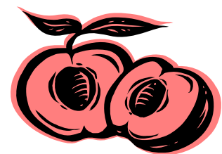
Didascalia dell'immagine o della fotografia